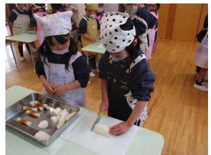
大根は1人、半分切りました！