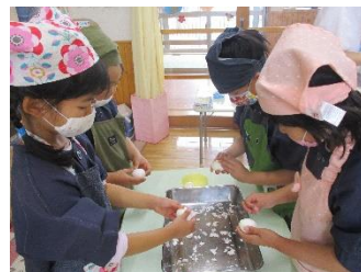
ゆでたまごも集中してきれいにむけました！