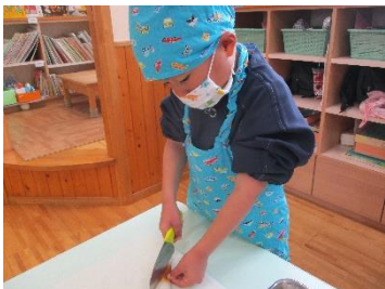
ちくわとこんにゃくは半分に切って～！