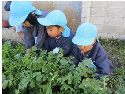
大根は前日に抜いて給食室まで 持ってきてくれました！